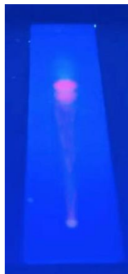
Gambar 1. Pola KLT Campuran ekstrak etil asetat campuran teh hijau dan teh hitam pada deteksi sinar UV \lambda 366 nm

Hasil skrining fitokimia, kombinasi ekstrak etil asetat daun teh hitam dan hijau mengandung metabolit sekunder alkaloid, flavonoid, fenolik, saponin, dan tanin (gambar 2). Indira (2018) menyatakan bahwa ekstrak etil asetat campuran teh hijau dan teh hitam